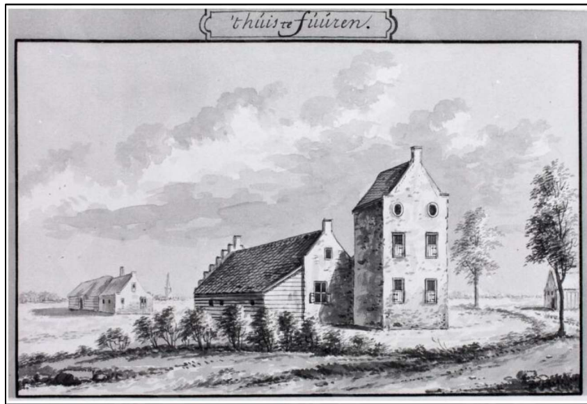
't Huis te Fúúren tekening van Abraham Rademaker