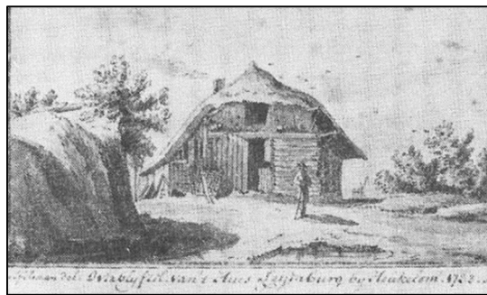
Boerderij bij Huys Leyenburg te Vuren 1733

Jan Vredenburg, Kastelen in Gelderland, Uitgeverij Matrijs, Utrecht 2013, p. 274.