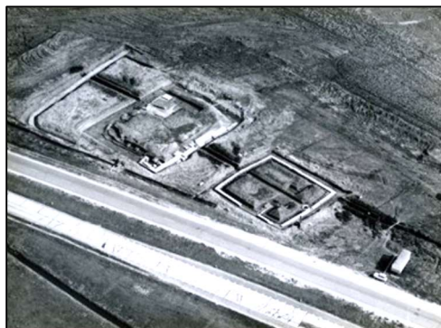
Luchtfoto kasteel Leyenburg in Vuren 1964